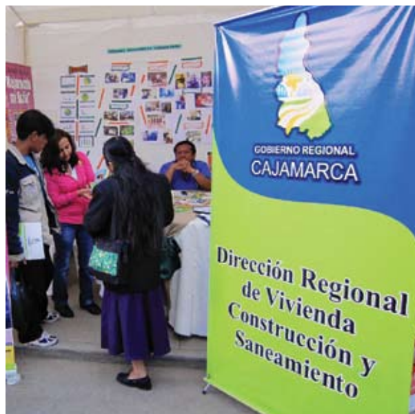
Feria de Oportunidades – Gobierno Regional de Cajamarca, 2010.