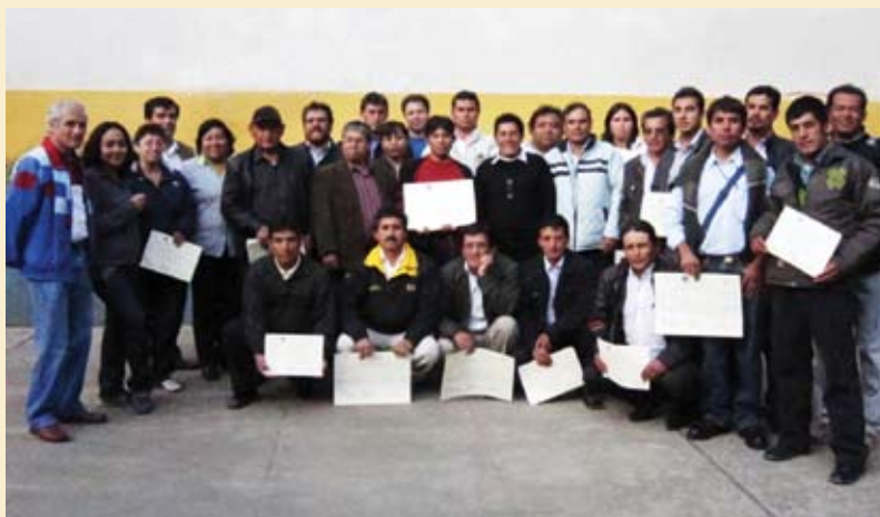
Funcionarios de la DRVCS y Municipalidades acreditadas en el Programa de Fortalecimiento a Gobiernos Locales, 2010.

La estrategia de trabajo radica en la intersectorialidad, concertación y la participación de la DRVCS en espacios y plataformas de diálogo para la gestión y posicionamiento del sector. En la actualidad, las funciones sectoriales vienen siendo asumidas por la DRVCS; no obstante, el proceso es de largo plazo, lo que implica que el Gobierno Regional deberá implementar los compromisos asumidos para continuar con el fortalecimiento, seguimiento, monitoreo y evaluación de las actividades propuestas en el Plan Estratégico Institucional 2009-2015 de esta Dirección.