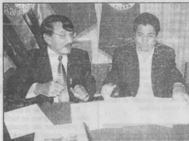
Firma de convenio de la DIRESA Cusco y CARE Perú.

Como se recordará, las estadísticas de muertes de personas infectadas con el virus de VIH SIDA en el Perú, demuestran que estos van acompañados con la tuberculosis, por ello la DIRESA Cusco, conocedora de esta realidad, fortalece sus estrategias de prevención y control del SIDA y la tuberculosis.